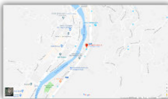
Via Paolo Anfossi 8