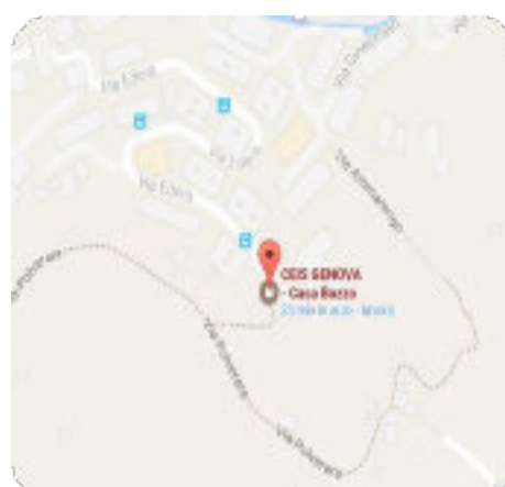
Via Edera 1