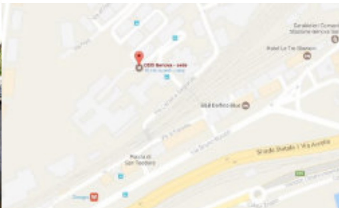
Via Asilo Garbarino 6B